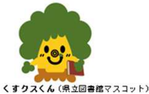
くすくすくん (県立図書館マスコット)