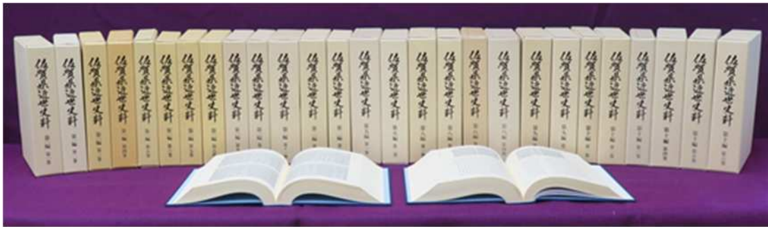
参考 これまでに刊行した『佐賀県近世史料』